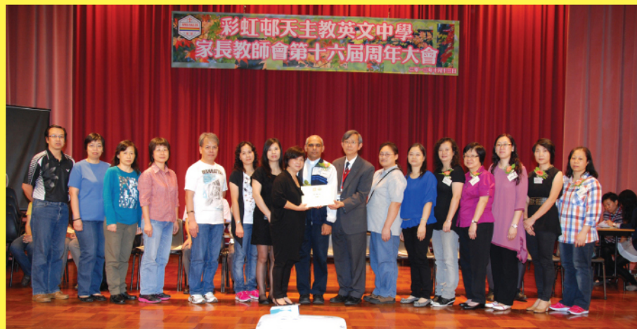
第15屆家長教師會委員。