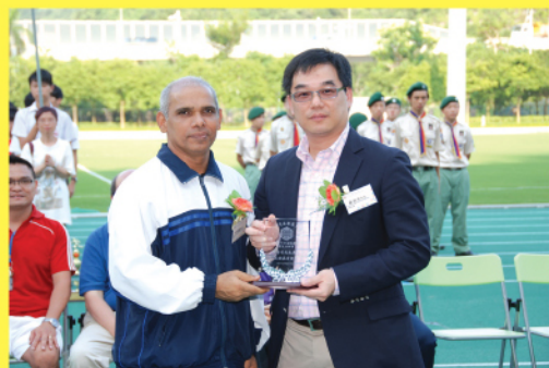
傑出舊生、運輸署助理處長蘇祐安先生(右)擔任陸運會閉幕禮主禮嘉賓。

本校第46屆陸運會於9月26及27日假將軍澳運動場舉行，當天邀請了傑出校友、運輸署助理處長蘇祐安先生擔任閉幕禮主禮嘉賓。