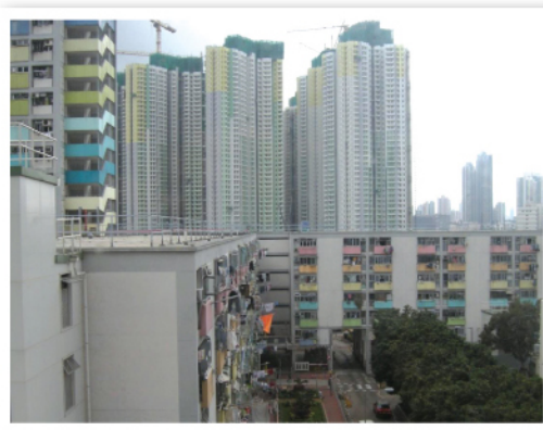
遠眺興建中的住宅單位，毗鄰便是啟德新發展區的校舍用地。

由於政府只推出一幅新校舍用地，來自不同區分的學校也申請，故競爭情況非常激烈，而有關結果將於2013年初公布。