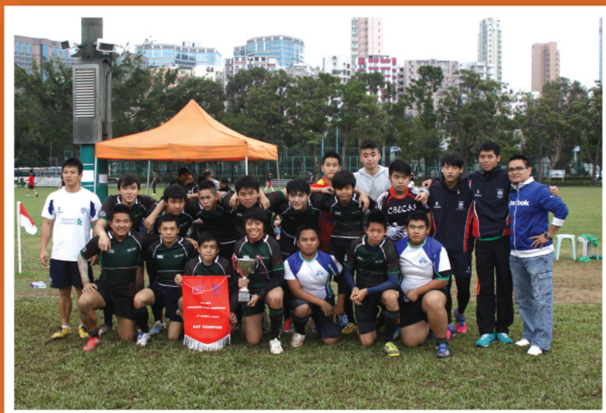
彩天欖球隊成員獲獎後合照。