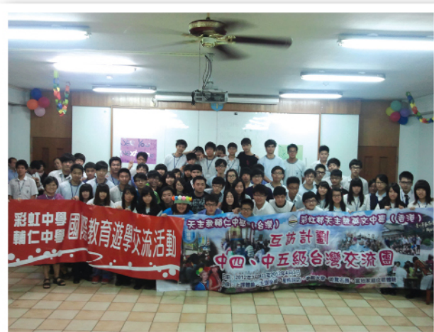
本校學生於上學年到訪台灣輔仁中學。