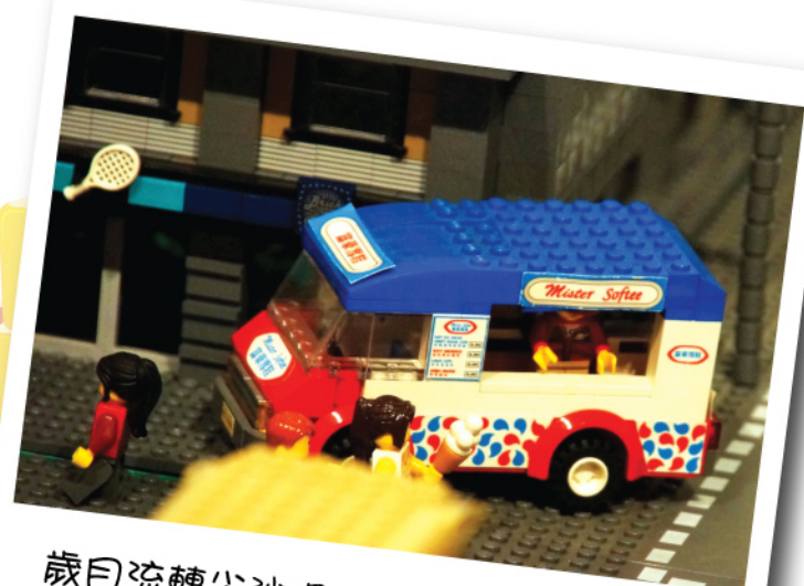
歲月流轉尖沙咀 @ 香港文物探知館。