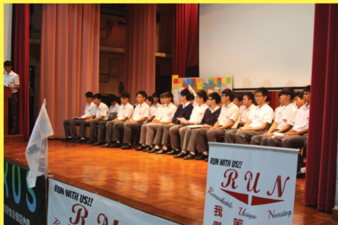
三個候選內閣成員在台上唇槍舌劍。

本年度的學生會競選日於10月4日在學校禮堂舉行。是次競選分別由一號「NEXUS」、二號「UNIQUE」及三號「RUN」三個候選內閣角逐，結果由三號候選內閣「RUN」以443票勝出。