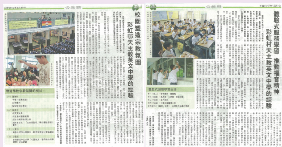
9月30日及10月7日的《公教報》報道。

《公教報》分別於9月30日及10月7日報道了本校如何在教學中保存和推廣宗教使命，當中包括學校如何在校園塑造宗教氛圍，以及介紹學校為回應課程改革中「其他學習經歷」的要求，推動名為「始終有彩虹——『生命馬拉松』學生體驗服務計劃」。