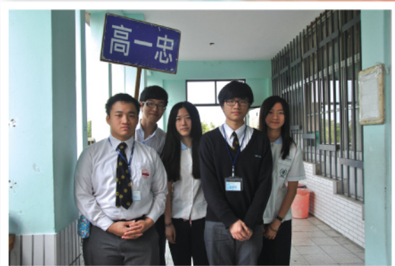
台灣輔仁中學學生歡迎彩天學生。