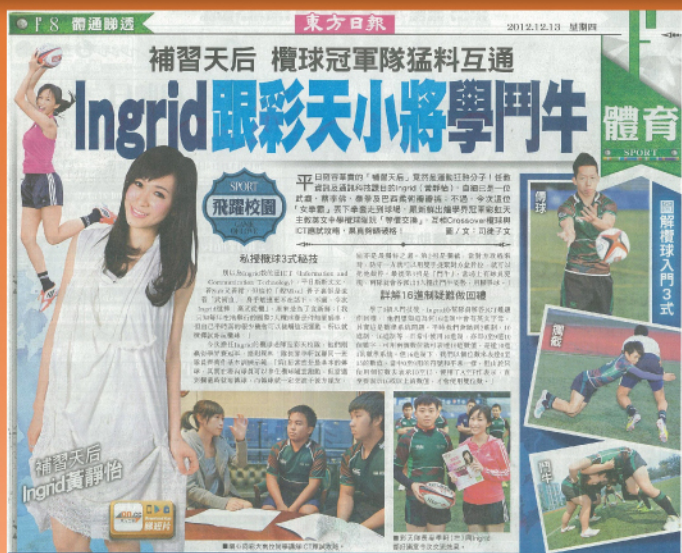
《東方日報》採訪本校欖球隊。