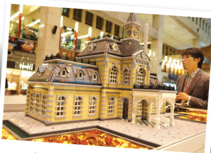
積木完整重現台灣古蹟車站。