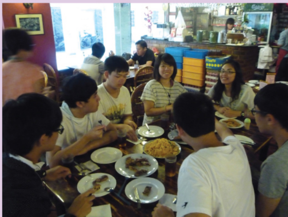
導師和同學們興奮地享用葡國餐。