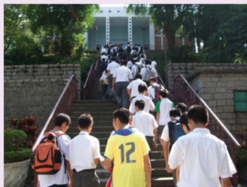
彩天學生魚貫進入宏偉的聖依納爵堂。

第二次的交流活動則由彩天的學生參觀九龍華仁書院。華仁的校舍比彩天的校舍大很多，那兒的游泳池、網球場、草地足球場、硬地足球場、籃球場都令學生大開眼界，也讚嘆位於九龍華仁書院的聖依納爵堂的宏偉。