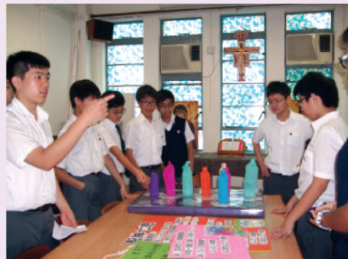
華仁學生到訪，參觀宗教室。

第一次的交流活動包括參觀彩天的校舍及進行籃球比賽，兩校的學生在是次活動中開始彼此認識，並交流兩校不同的文化。