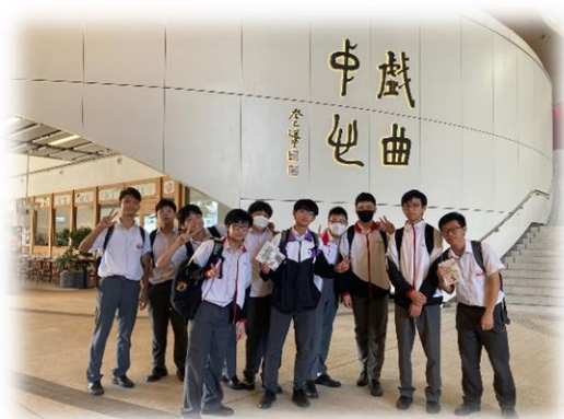
學生於戲曲中心合照

是次活動令不少學生反思傳統文化的價值，了解到其優美、值得欣賞之處，並希望粵劇能繼續傳承下去。因此，學生均表示是次體驗十分難得，讓他們獲益良多。