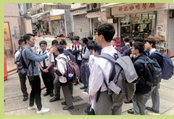
學生們留心聆聽長春社文化資源古蹟中心的導師分享