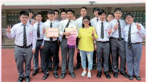
計時隊獲教區小學嘉許