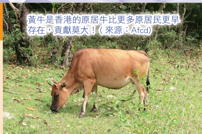
黃牛是香港的原居牛比更多原居民更早存在，貢獻莫大！

目前香港有 1000 多頭流浪牛，其中可分為兩類：黃牛及水牛。黃牛的分布範圍比較廣泛，喜歡在山坡及草地上吃草。至於水牛，則多數聚居於濕地，大部分時間在低地棲息。