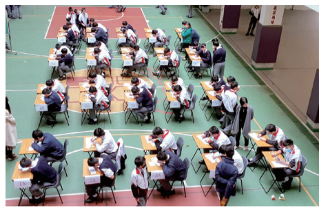
學生聚精會神地進行硬筆書法比賽