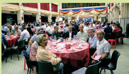
離職老師也來湊熱鬧、敘舊