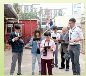
利用 Eduventure 的電子程式參觀坪石邨三山國王廟