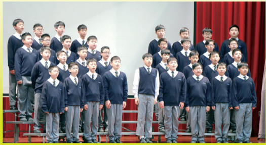
中一乙班學生表演普通話集誦