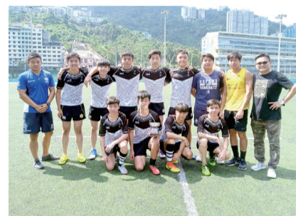
乙組隊員獲頒銀碗賽冠軍獎杯

本校 11 位乙組欖球隊隊員在校際七人欖球比賽表現優異，先後於銀碗賽八強賽、四強賽及決賽擊敗對手，勇奪銀碗賽冠軍。