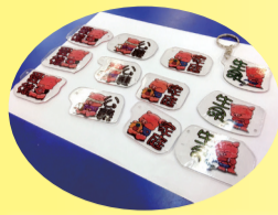
以天主教五大核心價值為主題的豬仔襟章及鎖匙扣

企財科、視藝科及宗公組的師生於 2019 年 2 月 2 日至 4 日，參與了在樂富聖博德小學舉辦的「天主教中九龍總鐸區——堂區聯辦農曆新年嘉年華」，並設置攤位售賣貨品。師生以「主恩滿載」為題悉心布置攤位，因應農曆豬年即將來臨，攤位售賣豬仔布娃、自家製作的天主教五大核心價值豬仔鎖匙扣、豬仔襟章，讓學生從中實踐不同的銷售方法和技巧。