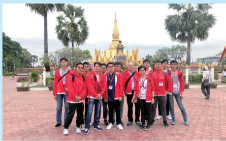
師生於老撾塔曼寺前留影