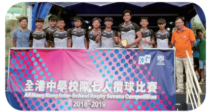
甲組欖球隊員奪得亞軍