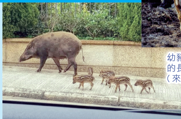
香港市區常有野豬出沒，甚至大模斯樣走上行人路。

野豬的適應力強，可棲息於林地、草原和農田等不同的生活環境。在香港最常見於大嶼山、西貢、沙頭角及船灣淡水湖北面。此外，牠們是夜行性動物，會於清早或黃昏時份，到樹林、草地以至鄰近農田覓食。因此，有不少晨運客都曾有與野豬相遇的經歷。