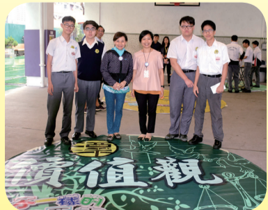
在午息時間舉行不一樣的漂書活動