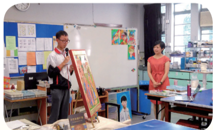
何校長與學生一起參與聖像靈修工作坊