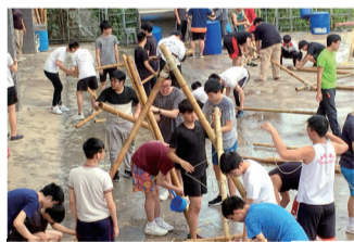
學生合力製作羅馬炮架