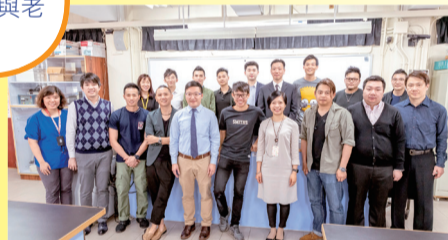
來自不同行業的舊生大合照