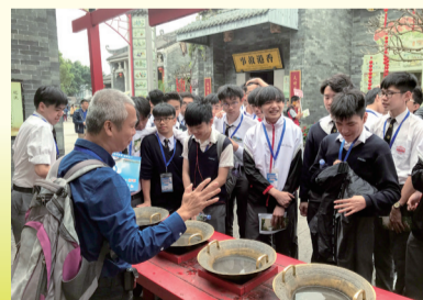
學生們對嶺南文化甚表興趣