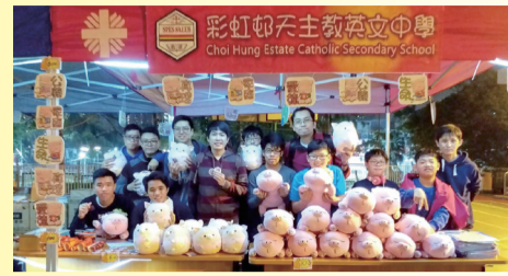
可愛的豬仔布娃成為年宵攤位的主角

企財科、視藝科及宗公組的師生於 2019 年 2 月 2 日至 4 日，參與了在樂富聖博德小學舉辦的「天主教中九龍總鐸區——堂區聯辦農曆新年嘉年華」，並設置攤位售賣貨品。師生以「主恩滿載」為題悉心布置攤位，因應農曆豬年即將來臨，攤位售賣豬仔布娃、自家製作的天主教五大核心價值豬仔鎖匙扣、豬仔襟章，讓學生從中實踐不同的銷售方法和技巧。