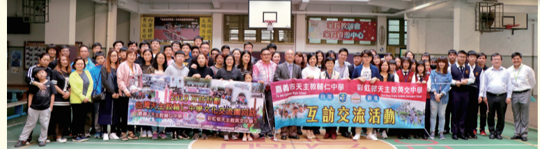
輔中師生抵港後出席本校為他們舉行的歡迎會