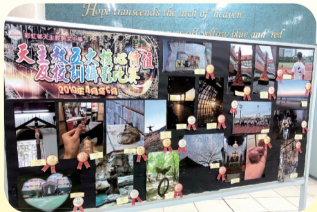
「天主教核心價值及校訓攝影比賽」得獎作品展

本年度彩天文化藝術月亦與視藝科合作，舉辦「天主教五大核心價值及校訓攝影比賽」，讓學生拍攝與天主教五大核心價值和校訓「望、救」相關的校園設計，得獎作品更會在學校公眾地方展示。