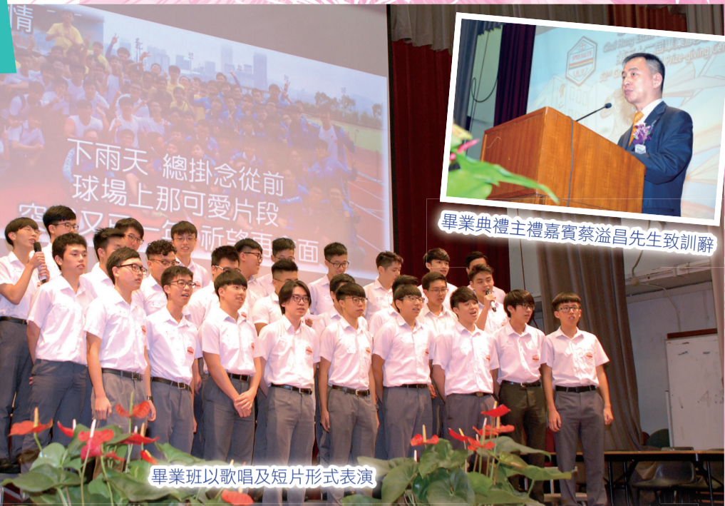
畢業班以歌唱及短片形式表演