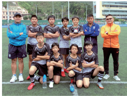
欖球丙組校隊勇奪銀碗賽冠軍