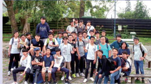
5A 班學生於香港仔水塘郊野公園合照

各級學生在不同營地進行舒展身心的活動，例如足球、籃球、攀石、射箭、繩網等，期間亦由學生帶領進行班本遊戲，除增進師生間的情誼外，也提升學生的領導才能。