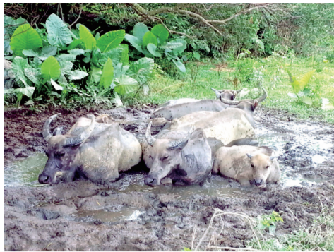
水牛愛在夏天時躺在沼澤中泡浸日光浴，藉以散熱及驅走身上的蚊蟲。

香港能有今天繁榮，耕牛功不可沒。原居牛在香港的歷史可追溯至二千年前的東漢，香港已有中原人士南遷並耕作，牠們協助先民開荒和耕種，是先民的合作夥伴。過去牠們居有棚，作有息，閒時吃草，且愛與村民聚居，性格溫馴而近人。隨着香港經濟轉型，農業式微，村民棄耕離村謀生，不忍宰殺和賣掉黃牛，於是便把牛放逐，任其在山頭野嶺生活。牠們開枝散葉，繁衍出自己的族群，分布於新界不同的區域。可是，政府在發展鄉郊時，忽視了牠們的需要，以致牛群流離失所。