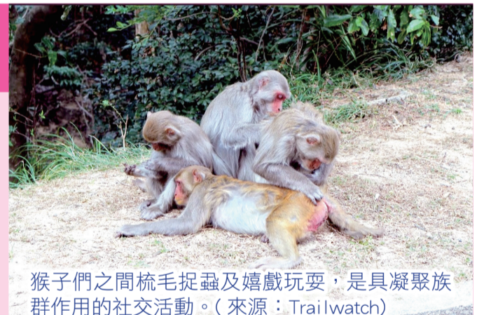
猴子們之間梳毛捉蟲及嬉戲玩耍，是具凝聚族群作用的社交活動。

野生猴子能適應不同的生境，如森林和草原，甚至市區。牠們的主要食物為植物的葉、果實、花、根、嫩芽及樹皮，但偶然也會捕食一些昆蟲。