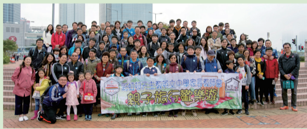
全體師生、家長大合照

一年一度的家教會旅行日於 2019 年 1 月 13 日舉行，當天約有 100 多位家長、學生及老師參加。本年的主題是「香港地標幸福摩天輪、海事博物館、山頂、山頂盧吉道、山頂盧吉道『仙橋霧鎖』、粵菜午宴親子一天遊」。全體家長及師生懷着愉快的心情，認識香港規劃、發展及海事知識，欣賞維港兩岸及山頂景色，並享用豐富美味的午膳，享受一天充實的旅程，滿載而歸。