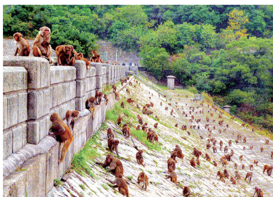
九龍水塘附近的猴群

1913 年，香港興建了新界地區的第一個水塘——九龍水塘，但興建時有人發現水塘附近長有許多名為「馬錢」的小灌木。馬錢是香港四大毒草之一，誤服可以致命，但馬錢卻不會對獼猴有任何影響，更是牠們喜愛的食物。當時有人擔心馬錢的果子如跌在水塘會影響水質，令人中毒，於是有人放生數隻獼猴負責將馬錢吃掉，保障食水安全。經此放生後，這些獼猴便開始於九龍水塘一帶生活，至今更已繁衍成一個數目龐大的族群。所以，獼猴在水塘附近聚居，乃是肩負守衛水塘的重任呢！