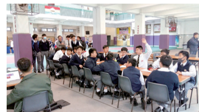
學生齊心合力參加班際合 24 比賽