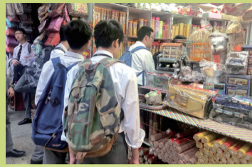
學生從參觀紙紮舖認識中國傳統喪葬紮作

中文科與長春社文化資源古蹟中心合辦「漫步艱辛歲月——死亡之旅考察活動」，於 2019 年 3 月 1 日帶領 20 位中四至中五級學生由文武廟出發，沿途經過卜花園，參觀廣福義祠（百姓廟）、東華醫院及紙紮舖。學生們跟隨前人的足跡，重溫早期香港人的艱辛歲月，並認識他們如何在華洋共處下化解分歧，為香港的社區及公共發展寫下重要的一頁。透過走一趟「死亡之旅」——衝破迷信障礙，讓學生認識中國傳統死亡觀念，明白生、老、病、死是人生必經的階段，從而學會珍惜現在。