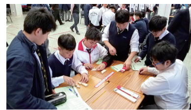
學生踴躍參與午間活動

數學科於 2019 年 1 月 7 日至 1 月 11 日，在校園內舉辦了一年一度的數學周。活動內容豐富，有每日一數、數學日記、齊閱讀文章、數學遊戲、初中班際數學比賽、Rummikub 比賽及班際合 24 比賽。所有比賽氣氛激烈，參加的學生寓學習於遊戲，滿載而歸。