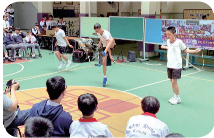
花式跳繩隊的學生於藝墟表演

彩天藝術日設多個手工藝攤位，午間藝墟則讓學生一展體藝才華。適逢友伴學校台灣天主教輔仁中學於 3 月 30 日至 4 月 4 日回訪交流，輔中師生獲邀參與彩天藝術日和午間藝墟的活動，他們對彩天學生的表演讚口不絕，而輔中學生也特地獻唱。兩地天主教師生藉文藝交流建立情誼。