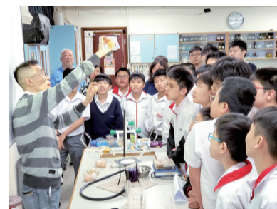
學生們對於彩蛋實驗相當好奇