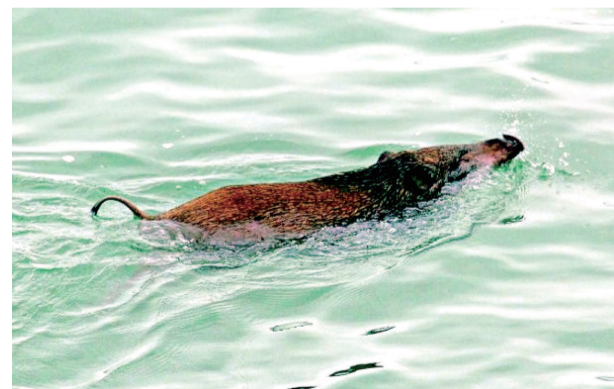
野豬是游泳健將

「生性兇惡」、「攻擊性強」等詞常用作形容野豬，加上體型龐大，令不少人對野豬望而生畏。其實野豬十分膽小怕人，遇到人類時多會避開，不會主動襲擊，只要我們不大叫或追趕牠們便可。雖然野豬不如傳聞中可怕，但我們也不應餵飼牠們，因這樣做會把野豬吸引到城市邊緣，離開原有的生境，改變牠們的行為，也增加野豬與人類的衝突機會。社會上早前有人提倡引入野豬「天敵」，或將牠們送到無人島，終發現並非解決之道。野豬的智力、身體構造，讓牠們擁有過人的生命力，是頑強、堅毅的動物。我們應多了解其習性，找出與其共處之道。