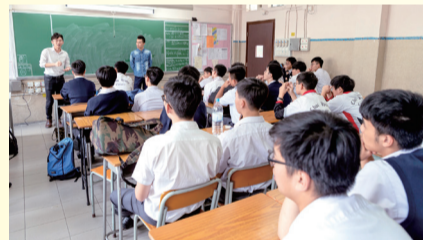
學生專心聆聽師兄分享

生涯規劃組與舊生會在 2019 年 5 月 3 日合辦職業導向分享活動，當天邀請了 18 位舊生回校為中四、中五級學生作分享，舊生分別來自 11 個職業界別，如律師、飛機師等。學生於活動中能按個人興趣選擇聆聽不同職業界別的資訊，期間又可向舊生提問，互相交流意見，為未來升學就業作準備。