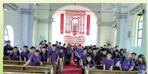
參觀西貢鹽田梓聖堂

是次回訪活動共有 18 個家庭擔當接待工作，除帶領輔中學生到不同香港景點遊覽外，輔中的男生更有機會在接待家庭留宿，體驗本地居民的住屋環境。