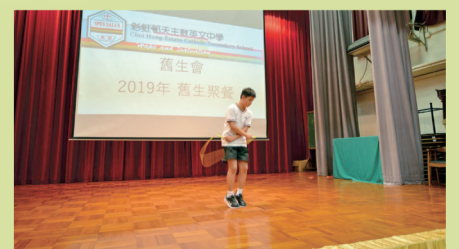
學生表演花式跳繩