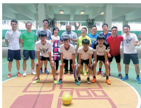
修士、師生足球賽前合照