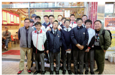
學生訪問彩虹邨舊式茶餐廳後與老闆合照