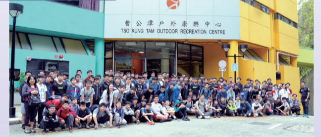
中二全級學生在曹公潭戶外康樂中心展開活動