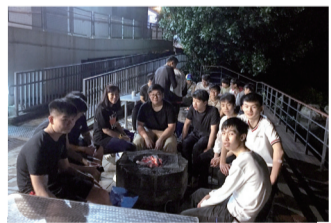
學生與班主任邊燒烤邊談天

本校中四級師生於 3 月 21 日至 22 日在青年協會西貢戶外訓練營舉行宿營活動。透過兩天體驗活動，讓學生走出校園，與老師、同學暢聚共歡，提升他們的歸屬感。是次宿營的活動豐富且多元化，包括正面價值教育講座、運動好處分享會、毒品種類展板介紹暨問答比賽、高空游繩、製作羅馬炮架、河畔燒烤、師生夜話等活動，從而培養學生正面價值觀和團隊精神。