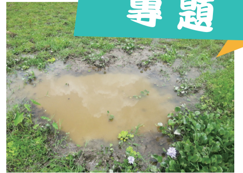
沼澤化的小坑洞