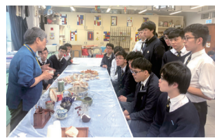
榮休的侯英持老師向學生講解茶葉種類和沖泡方法

本年度的文化周於 2019 年 2 月 25 日至 3 月 1 日舉行，主題為「字字珠璣」，期間舉行了一連串的活動，如撕紙藝術工作坊、專題研習分享、六書短片欣賞、老師好書分享、午間活動、飲食文化分享會。