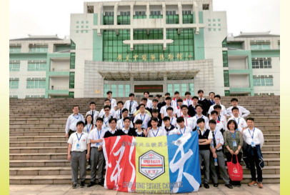
中五級學生參觀廣州中醫藥大學