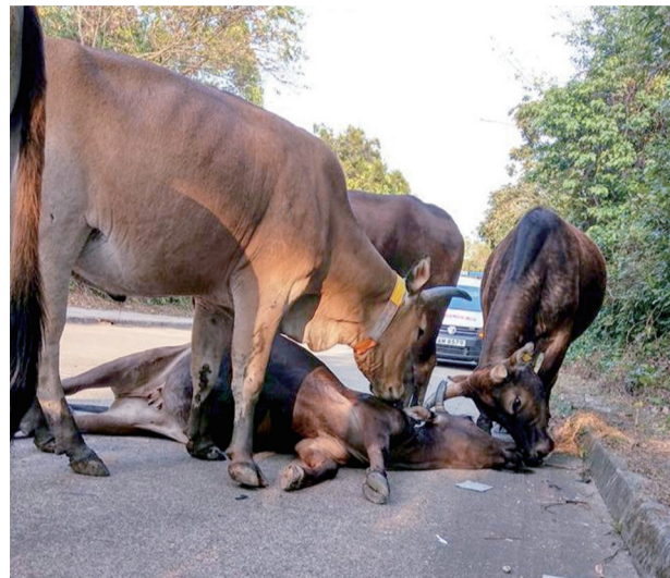
香港不時會發生流浪牛被車撞倒的意外

牛是群居牧畜動物，即使遷移了，甚至重複被驅趕，但因熟悉行走過的道路，也會重返原來棲息地。地方發展，環境改變，過往行走的山路，現在已是行車馬路，對牛而言，原本的家園不但變得面目全非，更是危機重重。