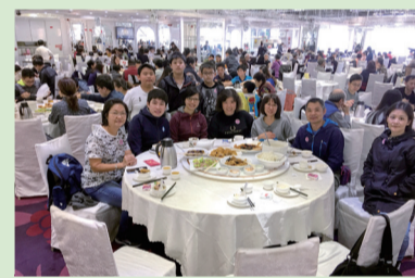
家長、師生共享午膳